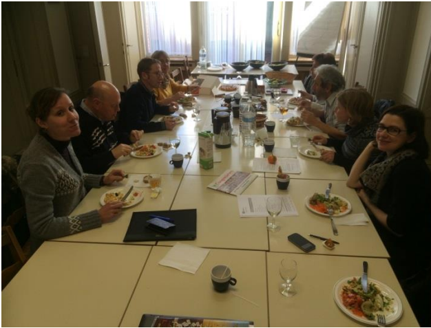
Eerste vergadering WIN in 2015