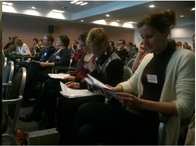
Studiedag 2015 : Sfeerbeeld