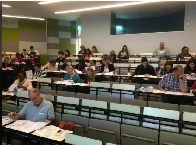
Organisatie workshop 'Build your own Infection Control Link Nurse' in CHU Brugmann.