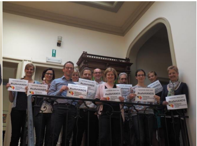
Deelname WIN aan de promotiecampagne #saveHANDS van de WHO